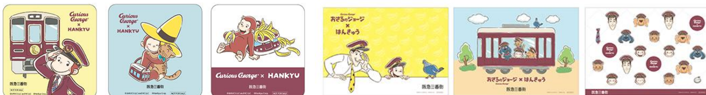
【オリジナルランチョンマット】3種