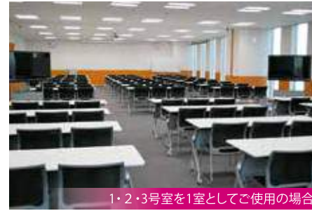
1・2・3号室を1室としてご使用の場合