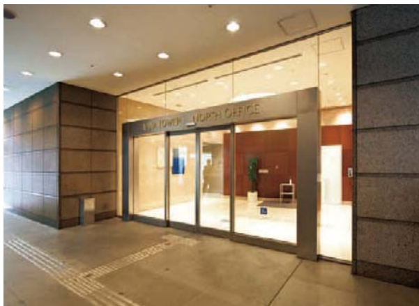
1Fエントランスホール