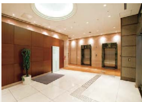
1Fエレベーターホール